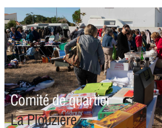
Comité de quartier La Plouzière