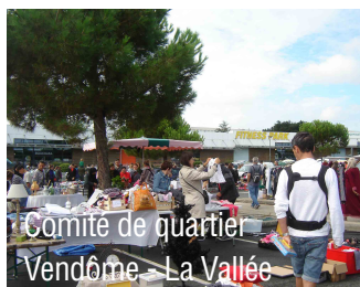
Comité de quartier Vendôme - La Vallée