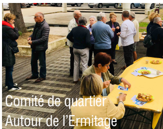
Comité de quartier Autour de l'Ermitage