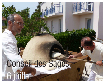
Conseil des Sages 6 juillet