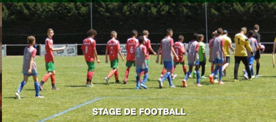
STAGE DE FOOTBALL