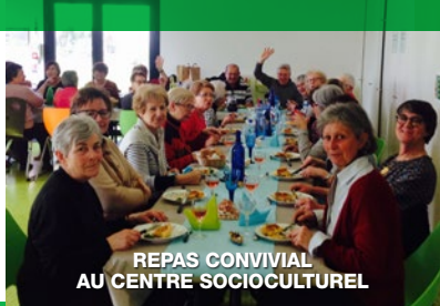
REPAS CONVIVAL AU CENTRE SOCIOCULTUREL