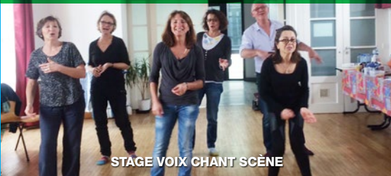
STAGE VOIX CHANT SCÈNE