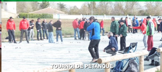
TOURNOI DE PÉTANQUE