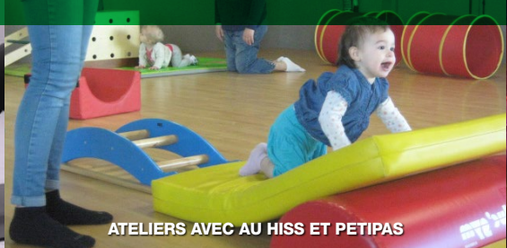
ATELIERS AVEC AU HISS ET PETIPAS